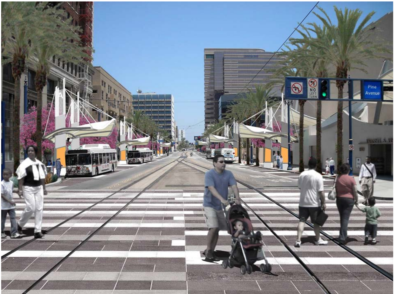
La ilustración del artista muestra la intersección de First Street y Pine Avenue en el centro de la ciudad de Long Beach después de terminada la renovación de la zona.

LONG BEACH, CALIF. (4 de agosto de 2010) – A partir de l 29 de agosto, Long Beach Transit cambiará temporalmente la ruta de sus paradas de autobús para dar lugar a la mejora y modernización del Transit Mall de Long Beach ubicado en First Street entre Long Beach Blvd y Pacific Avenue. Se espera que el proyecto de $7 millones, que es posible gracias al financiamiento del paquete de estímulo económico federal, concluya en la primavera de 2011. Durante la construcción, el acceso peatonal y las operaciones de la línea azul del sistema de transporte Metro continuarán operando y los negocios permanecerán abiertos.